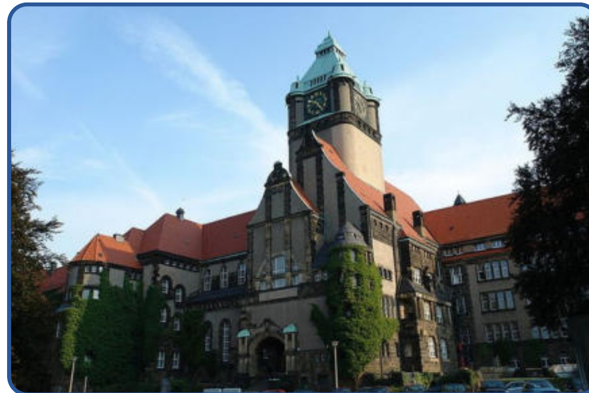
Technische Universität Dresden

Навчання відбувається за програмою Lehramt.