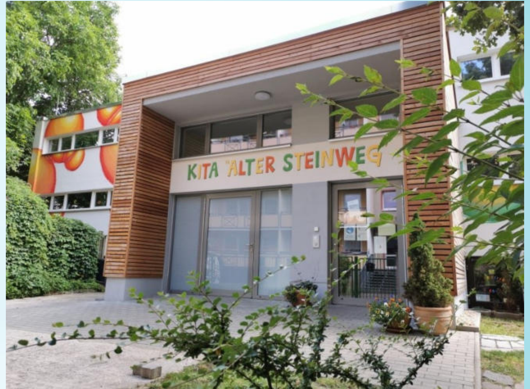
Kindertagesstätte "Alter Steinweg"